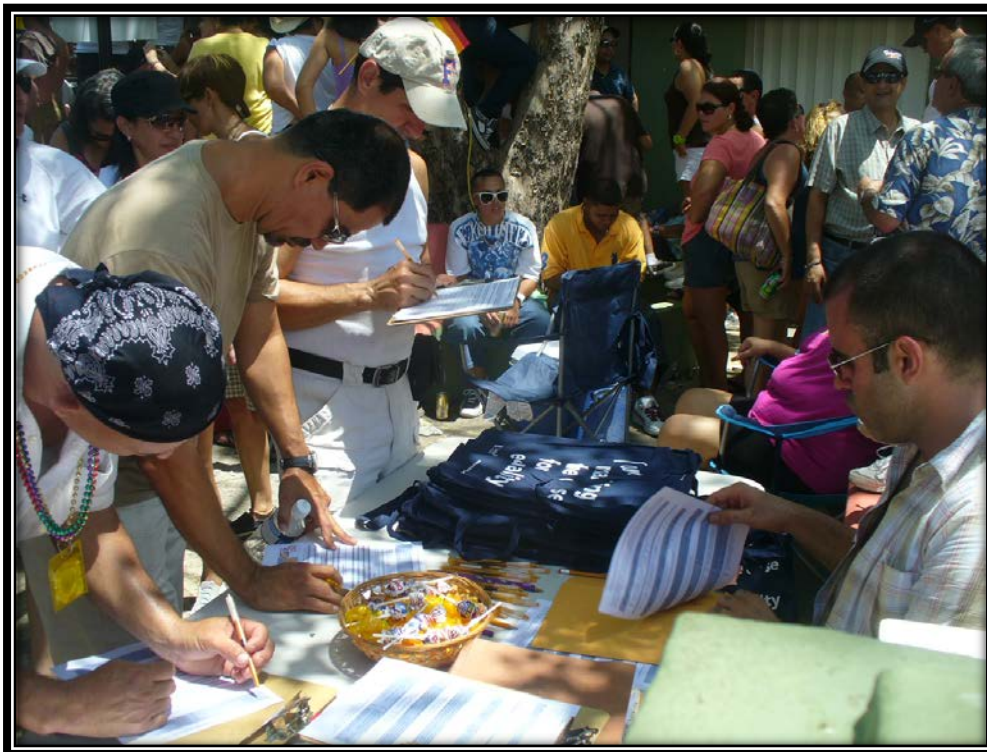
Miembros de la comunidad LGTBTT en Puerto Rico completando la primera encuesta sobre salud LGTBTT durante el evento Parada Orgullo Gay 2010 realizado en la Playa de Boquerón, Cabo Rojo, Puerto Rico