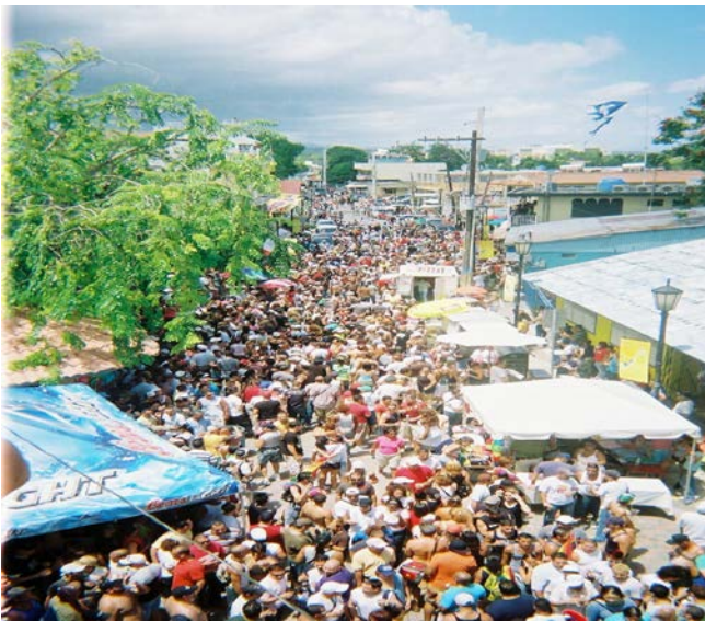
Los desfiles de las Paradas Orgullo Gay en Puerto Rico unieron a miles de miembros y aliados de la comunidad LGBTT.