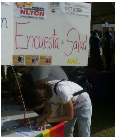
Miembros de la comunidad LGBTT llenando las encuestas sobre salud en el desfile de orgullo San Juan 2010

En noviembre de 2009, los defensores locales del control del tabaco condujeron la encuesta en una cumbre educativa local de LGBTT organizada por el grupo "Saliendo del Closet". Durante el evento de dos días, los voluntarios de la NLTCN ayudaron a recoger más de 96 encuestas terminadas. Los asistentes respondieron positivamente a la encuesta y estaban ansiosos por conocer los resultados, ya que estas abarcaron sus preocupaciones y las usaron para mejorar las acciones de defensa y los resultados de salud de LGBTT.