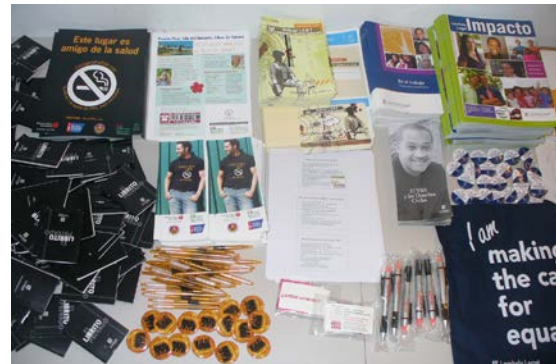
Control del tabaco y materiales educativos relacionados con la salud distribuidos con la encuesta en varios eventos de orgullo LGBTT en 2010

salud, las realidades y perspectivas de los trans. La estrategia utilizada más importante fue la inclusión de miembros de las comunidades trans en el proceso de toma de decisiones desde el inicio del proyecto para desmentir los mitos, las suposiciones sin fundamento, los estigmas y las ideas equivocadas acerca de esas comunidades. Los miembros de la NLTCN en Puerto Rico abarcaron el tema de la salud de los trans al aprender la nomenclatura correcta y evitar el uso de tantos estereotipos negativos en referencia al género de los trans y su sexualidad. La educación de las personas sobre las comunidades trans sigue siendo una prioridad para los defensores.